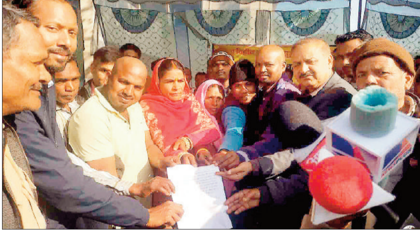
लिखित आश्वासन देते अधिकारी।

गुरु घासीदास नेशनल पार्क सहित घने जंगल पर पहाड़ों पर स्थित बस्तियों में विद्युत विस्तार की बात तो कोई सोच भी नहीं सकता था। विद्युत विभाग ने आधा दर्जन से अधिक सर्वे कराने के बाद इन गांवों में वन बाधा के कारण विद्युत विस्तार को असम्भव मान लिया था। क्षेत्र के राजस्व ग्रामों में भी विद्युत विस्तार को लेकर अनेक समस्याएं आ रही थीं। विद्युत अधिकारी विस्तार के लिए वन विभाग की अनापत्ति मिलने के बाद प्रक्रिया आगे बढ़ाने का आश्वासन दे रहे थे। अनेकों प्रयास के बाद भी जब सफलता नहीं मिली तो करौटी ए सरपंच ने